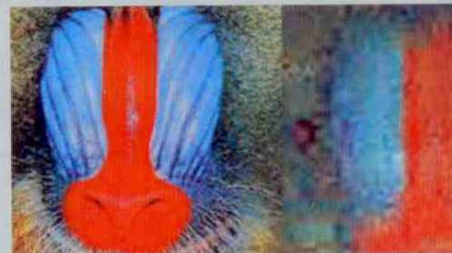
Met het prototype is een foto gemaakt (rechts) van een afbeelding. De beeldkwaliteit is vergelijkbaar met een camera met een miljoen pixels.

het intredende licht eerst een lens. Deze lens vormt een beeld op het Digital Micromirror Device (DMD), een chip met een raster van zeer kleine beweegbare spiegels. De configuratie van de spiegeltesjes, die